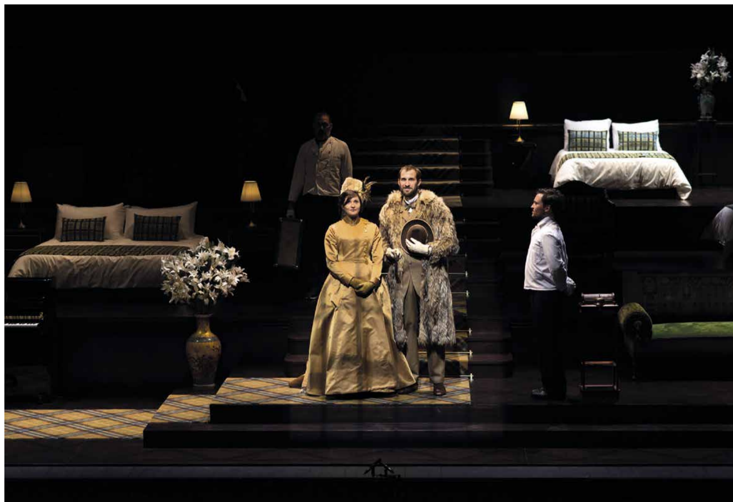
Luxe, calme , écrit et mis en scène par Mathieu Bertholet, prod. MuFuThe - Théâtre Vidy-Lausanne 2018 en coproduction avec le Théâtre de Valère, la Comédie de Genève et le Théâtre Populaire Romand, a bénéficié en 2017 du Soutien SSA à la commande d'écriture dramatique.