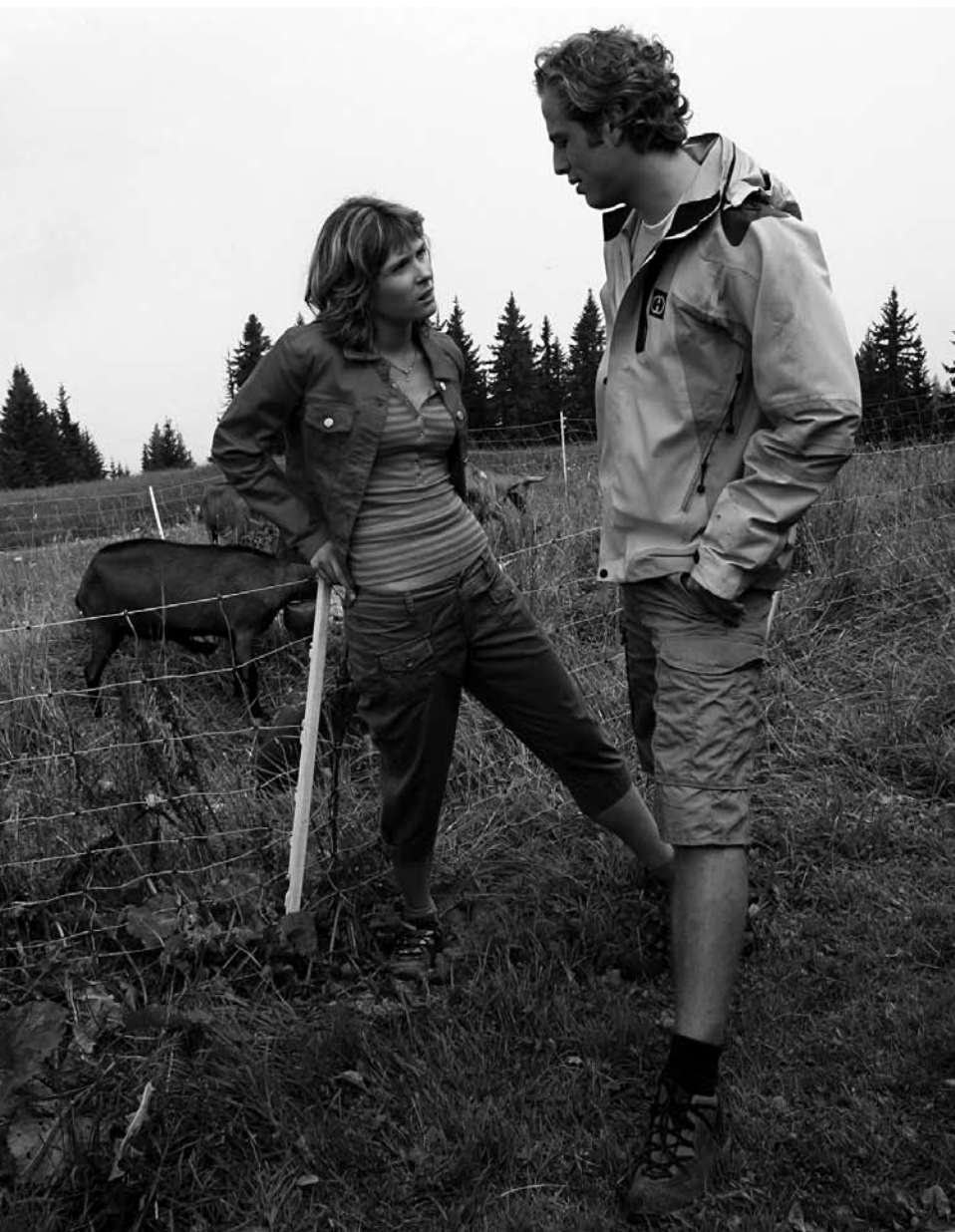
Erstausstrahlung von Heidi am 22.12.2007 auf TSR, gemäss offizieller Homepage eine «populäre Serie von 26 x 26 Minuten».