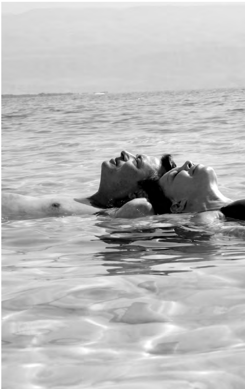
El nido vacío écrit et réalisé par Daniel Buman (Argentine, 2008), avec Cecilia Roth et Oscar Martinez.