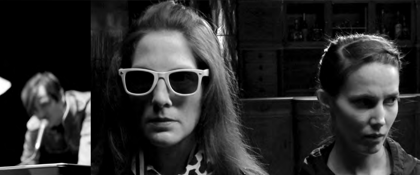
© MARIO DEL CURTO - HELENETOBLER - HANS MIEER