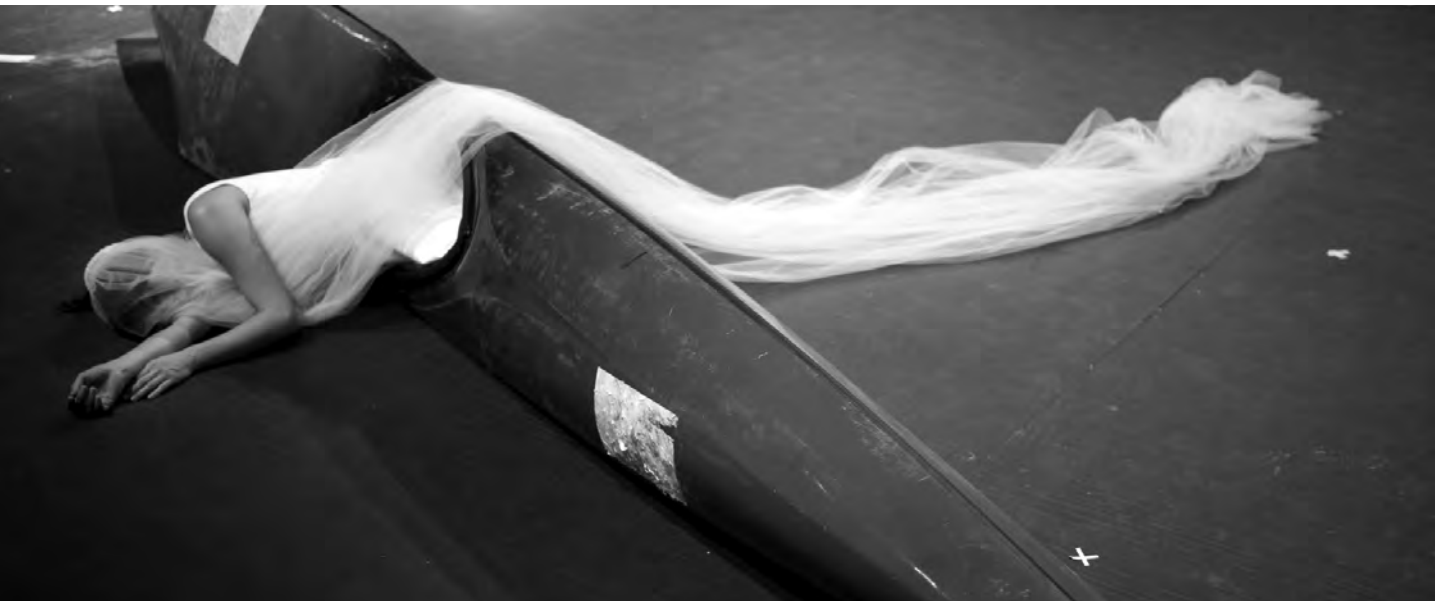
© GREGORY BATAARDON - MARIO DEL CURTO