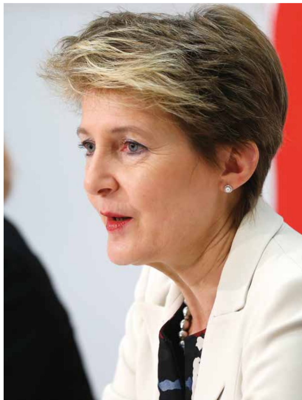
Bundesrätin Simonetta Sommaruga an der Medienkonferenz vom 22. November 2017 über die Revision des Urheberrechts.

Eine erste grosse Schwäche besteht darin, dass der neue Vergütungsanspruch die Entschädigung aufhebt, die auf der Grundlage des ausschliesslichen Zurverfügungstellungsrechts ausgehandelt wird. Die Urheberinnen und Urheber besitzen bereits das ausschliessliche Recht, die Nutzung ihres Werks zu genehmigen oder zu untersagen, so «dass Personen von Orten und Zeiten ihrer Wahl Zugang dazu haben», um die gesetzliche Formulierung betreffend Video on demand zu zitieren. Sie verhandeln dies mit den Produktionsfirmen, welche die Werke auch auf diese Weise kommerzialisieren. Es wäre wünschenswert gewesen, dass eine gerechtere Entschädigung durch die Schaffung eines neuen Vergütungsanspruchs gewährleistet worden wäre, der eindeutig paral-