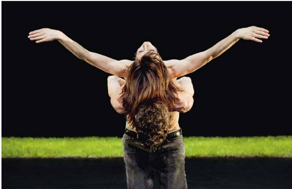
Une femme au soleil von Perrine Valli.